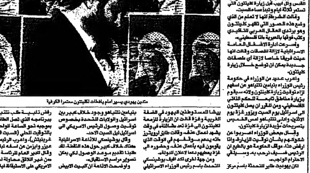
مفتون يهدون بترسيم ابحاث الكلبنتون مشرعا فكرة